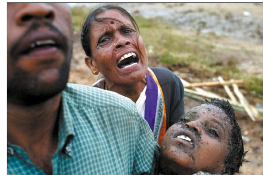
"På jorden skall folken gripas av ångest och stå rädlösa vid havets och vågornas dån." (Luk 21:25)

Att många sekter fokuserar på det apokalyptiska och eskatologiska får aldrig innebära att konfessionella lutheraner distanserar sig från det sunda och rätta talet om Jesu återkomst och domen. Jesu återkomst är en nödvändig punkt då vi överhuvudtaget gestaltar den kristna tron. Finns inte detta med är det inte kristen tro. Själva ordet 'kristen' är en synonym till "De som älskar Herrens tillkommelse" (2 Tim 4:8b).