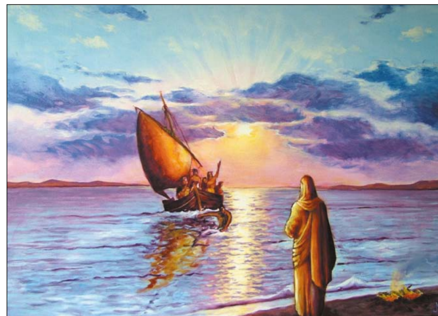
"Då kom han på stranden en morgon som lyste röd." Bild från gallerisela.dk. Målning av Marianne Mortensen.

1 Paulus undervisar församlingen i Rom om människans naturliga tillstånd i Rom 7:5: Ty så länge vi behärskades av vår onda natur, var de syndiga begär som väcktes til liv genom lagen verkamma i våra lemmar, så att vi bar frukt åt döden.