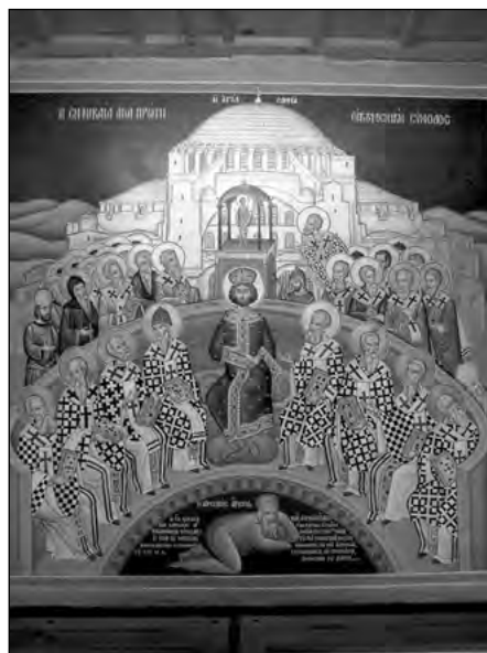
Bilden föreställer Athanasius, patriark av Alexandria, vid kyrkomötet i Nicea år 325, där han anförde striden mot Arius.

Luther påminner om arianernas tid då det fanns endast fem renlärliga biskopar, vilka även utsattes för förföljelse.