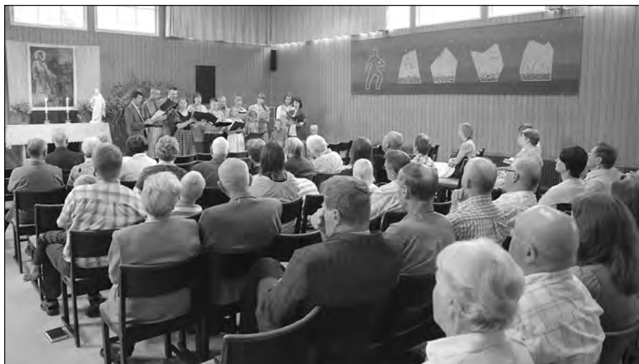
En talrik åhörarskara tog del av grundliga föredrag i Terjärv. På bilden sjunger Syskonkören.

I all synnerhet blir detta av intresse då man upptäcker att Skriften, som i sig själv är klar och tydlig, fått en klar tillämpning under en viss tid av kyrkans historia. Då blir det angeläget att se hur detta har förverkligats, vilka följder detta har fått, och om vi där kan hämta någon hjälp för att i vårt sammanhang gestalta det Den Helige Ande lär alla kristna i den heliga Skrift.