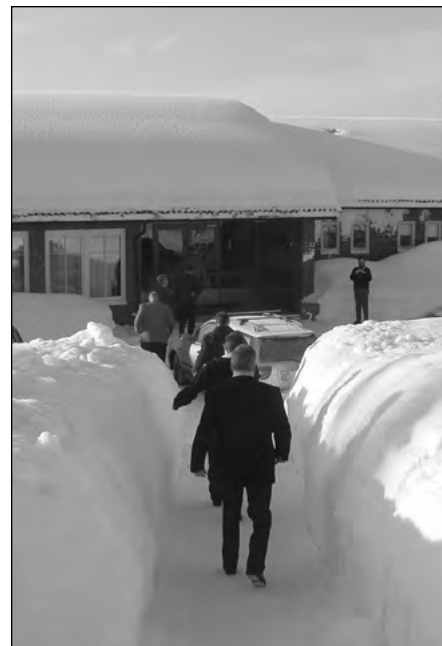
Vägen fram – här finns inga avvägar!