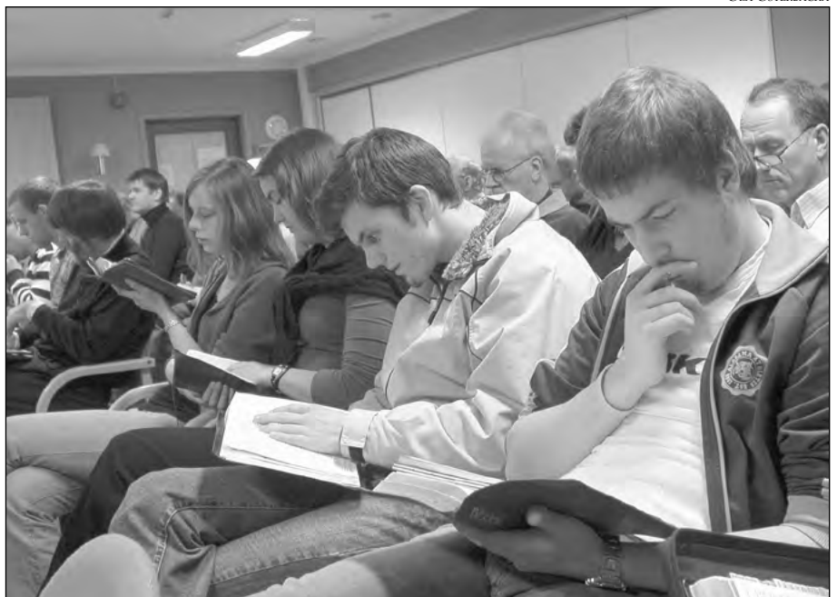
Också vid årets konferens var det ett markant ungdomligt inslag.