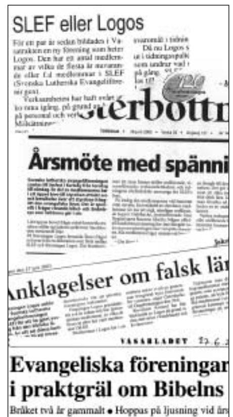
Ett smakprov på pressrubriker som föregick SLEF:s årsmöte i Karleby 27.6.2003