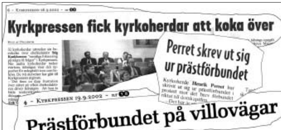
Några glimtar från Kyrkpressen sensommaren 2002.