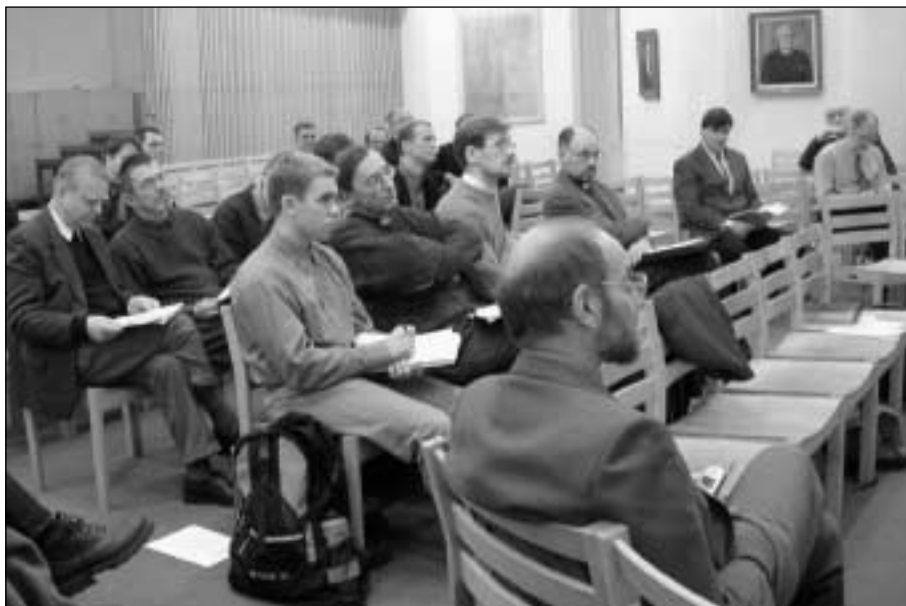
En del av deltagarna vid samlingen i Tammerfors 12.1.2003.

Två likartade möten hölls i början av januari, det ena i Tammerfors den 12 januari och det andra i Göteborg den 18 januari. Det senare har kommit att få en viss betydelse också för oss i